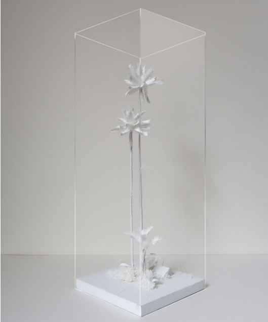
Del camino 02 Escultura de Papel 50 x 17 x 17 cm 2023 Precio: $5.350.000