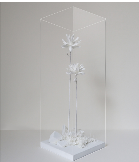
Del camino 04 Escultura de Papel 50 x 17 x 17 cm 2023 Precio: $5.350.000