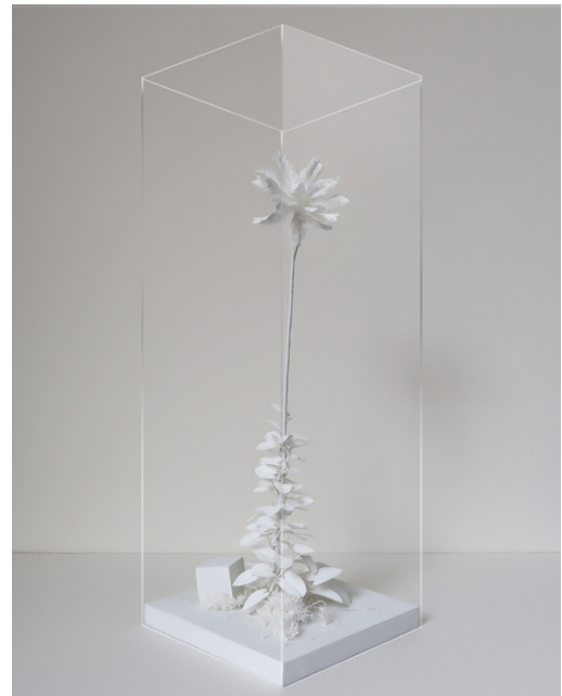
Del camino 03 Escultura de Papel 50 x 17 x 17 cm 2023 Precio: $5.350.000